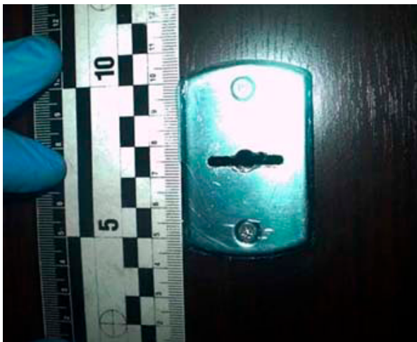
Фото 3. Следы на замке от воздействия отмычек

г) следы деформации конструкций при проникновении (фото 4);