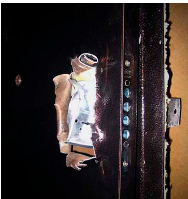
Фото 4. Сломанный дверной замок

г) следы деформации конструкций при проникновении (фото 4);