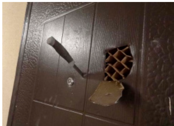
Фото 2. Металлическая дверь, вскрытая ножом

б) следы взлома и проникновения, к которым относятся вмятины на корпусе входной двери, выломы и заломы, особенно на недорогих металлических дверях (при этом очевиден факт, что дверь из дерева можно просто выломать, а дешевую металлическую из тонкого металла – разрезать ножом (фото 2));