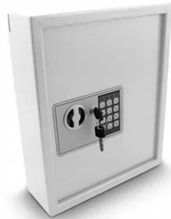
Фото 1. Ключница настенная металлическая с кодовым замком

ники данных жилых помещений используют при сдаче квартир в аренду для дистанционного заселения жильцов так называемые «Safe-Key» – мини-боксы 4 (фото 1).